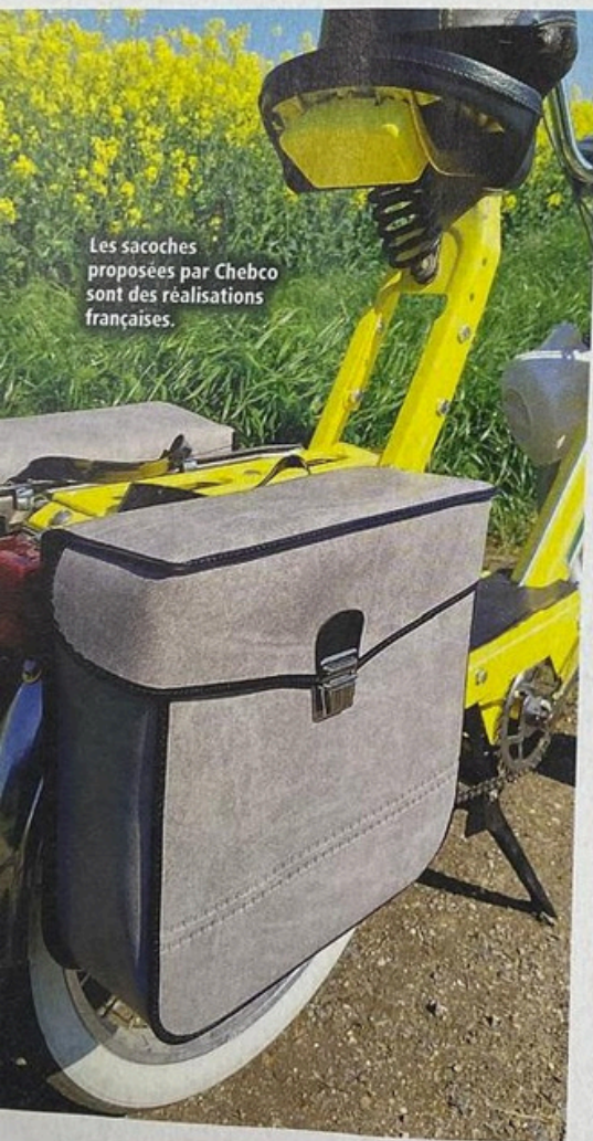
Les sacoches proposées par Chebco sont des réalisations françaises.