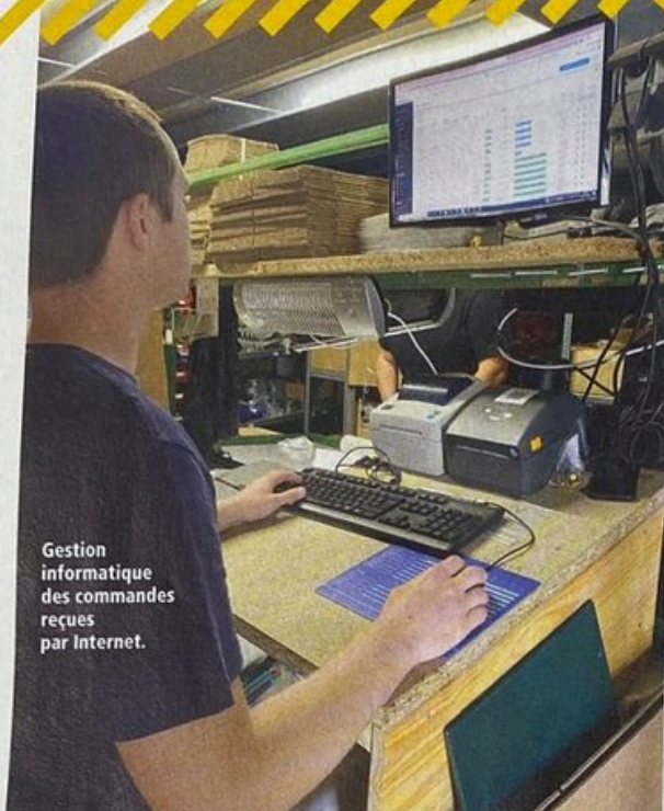
Gestion informatique des commandes reçues par Internet.